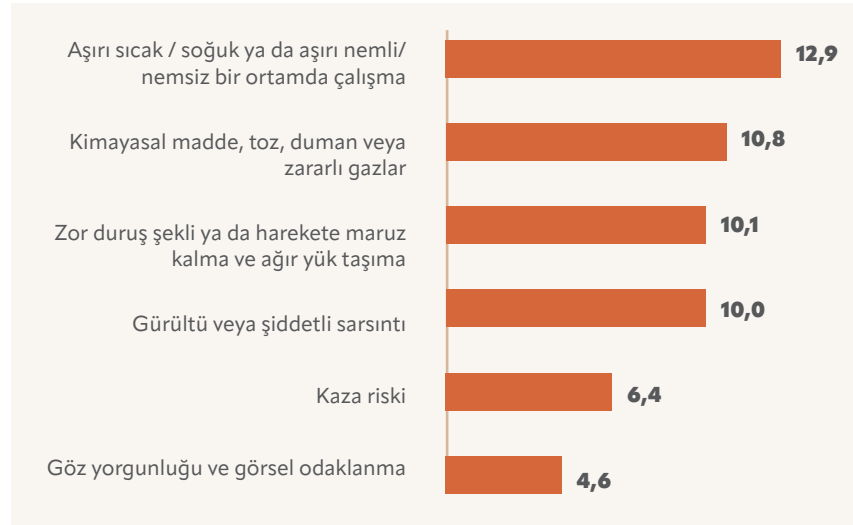
Tablo 2. Çalışma Ortamında Fiziksel Sağlığı Olumsuz Etkileyen Faktörler (Kaynak: Türkiye İstatistik Kurumu, Çocuk İşgücü Anketi Sonuçları, 2019.)

Çalışan çocukların çalışma koşullarına bakıldığında mevzuata aykırı şekilde önemli bir bölümünün sağlık ve gelişimlerini tehlikeye atacak koşullarda çalıştığı görülmektedir 54 . Kaza riski ile karşı karşıya kalan çocukların oranı %6,4 olmakla birlikte, TÜİK, çalışan çocukların %1,3'ünün çalıştığı yerde yaralanma veya sakatlanmaya maruz kaldığını, %4,4'ünün çalıştığı yerde yaralanma veya sakatlanma durumuna tanık olduğunu kayıt